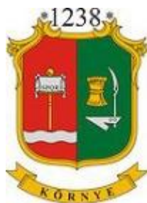
Környe Maďarská republika