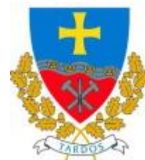
Tardos Maďarská republika