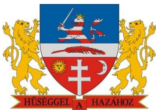
Bonyhád Maďarská republika