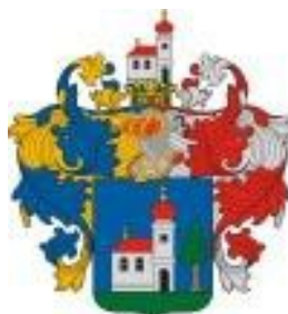
Nagyatád Maďarská republika