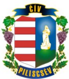
Piliscsév Maďarská republika