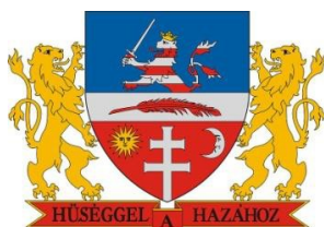
Bonyhád Maďarská republika