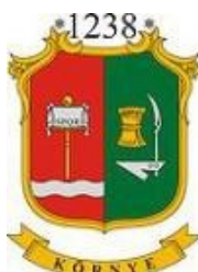
Környe Maďarská republika