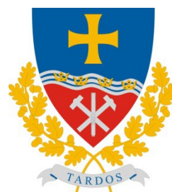
Tardos Maďarská republika