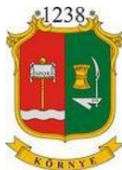
Környe Maďarská republika