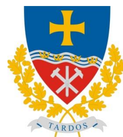
Tardos Maďarská republika