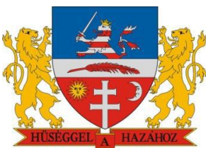
Bonyhád Maďarská republika