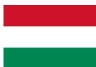
Szákszend Maďarská republika